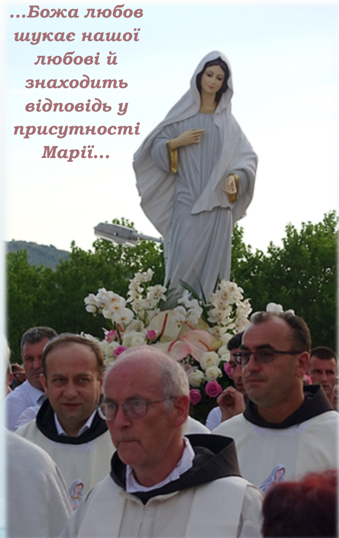
Фото: архів СМ 2х