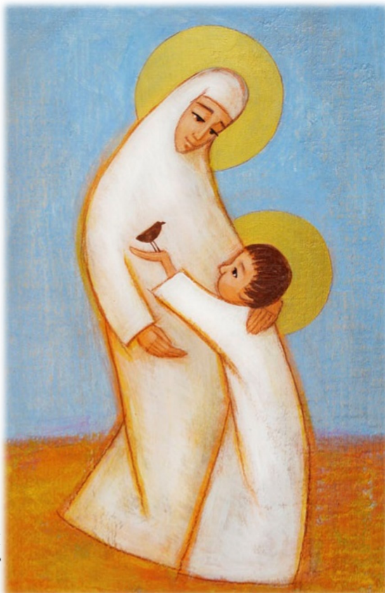
Автор: Діна Абеле

конфліктів між дітьми й батьками! Якщо б чоловік не забував, що для нього робить дружина, і навпаки, не було б ніколи розлучень! А якщо б ми вміли визнавати й дякувати одне одному за зроблене, то мали б радість і мир одне з одним.