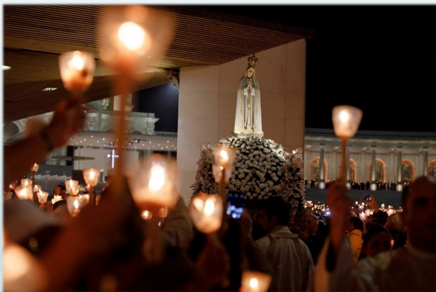
Фото: Santuário de Fátima

За матеріалами: - fatima1917.ru, -vatican.va