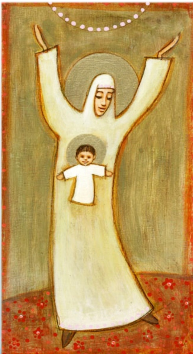
Малюнок: Діна Абеле