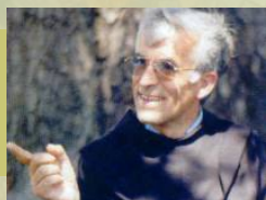
Отец Славко Барбарич

Одна з дивовижних подій, які пророко передували Євхаристії, – це, звичайно, манна в пустелі. У ній особливим чином проявляється і передбачається роль майбутнього хліба небесного. Життя, людське життя, багато в чому нагадує перехід через пустелю. Людина схильна до скорбот і страждань, переживає духовний і матеріальний голод та спрагу, у спокусах легко зупиняється перед перешкодами й проявляє невпевненість, утрачає сили та здається на шляху до обіцяного. Однак Бог завжди поруч і живить її. Він – Еммануїл, Бог із нами й за нас, новий хліб, хліб для життя світу.