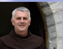
О. ЛЮБО КУРТОВИЧ

У січневому посланні Богородиця закликала нас до навернення, як і в цьому посланні, скерованому до нас перед часом, коли ми готуємось до найбільшого свята – Воскресіння Ісуса. У посланні від 25 лютого 1996 року Вона сказала нам: «Дорогі діти! Сьогодні закликаю вас до навернення. Це найважливіше послання, яке Я дала тут». Перші слова Ісуса, в Євангеліє від Марка, такі: «Сповнився час, і Царство Боже близько; покайтеся і вірте в Євангелію» (Мр. 1, 15). Заклик до навернення – це Божий заклик до радості та свободи. Тільки Ісус Христос може дати нам радість і свободу, і Він не прийшов, щоб щось у нас забрати, а щоб збагатити нас Собою. Як сказала свята Мати Тереза: «Чому ми сумуємо? Бо ми сповнені собою. Тому Бог не може наповнити нас Своєю радістю. Як очиститися? Залиште це Богові, Він знає, як це зробити».